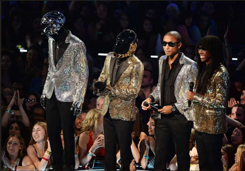
Daft Punk, Pharrell & Nile Rodgers – Get Lucky